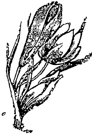
एक सौ चौतीस

सहायक मण्डलीने इस भाईकी दुःख कहानीको ध्यान-पूर्वक सुना और इस विषयमें अगले सप्ताह विचार करनेका वादा किया ।